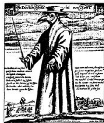
ภาพวาดนักบุญ ที่เขียนขึ้นผู้ป่วย จากเหตุการณ์ เดอะแบล็กเดธ ในขณะที่ไม่มีหมอคนไหน ขอมมาช่วยรักษาหรือเยียวยาให้