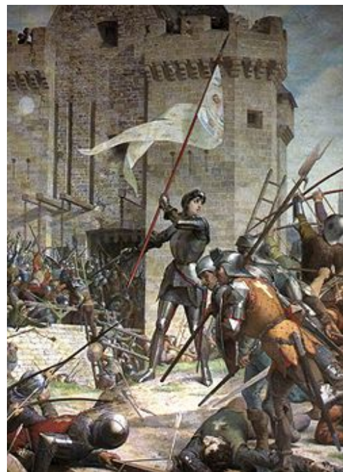
ภาพวาดสงครามร้อยปี

รัฐบาลของยุโรปไม่มีนโยบายที่แน่ชัด ในการรับมือกับปัญหาการแพร่ระบาดของเชื้อกาฬโรค เพราะไม่มีใครรู้สาเหตุของการแพร่ระบาด พวกผู้มีอำนาจปกครองส่วนใหญ่ จึงใช้วิธีห้ามการส่งออกสินค้าอุปโภคบริโภค กวาดล้างตลาดมืด ควบคุมราคาสินค้า และการหาปลาบริเวณกว้างแบบผิดกฎหมาย ความพยายามต่างๆ นานานี้ส่งผลกระทบไปถึงประเทศที่เป็นหมู่เกาะ อย่างเช่น อังกฤษไม่สามารถนำเข้าธัญพืชจากฝรั่งเศสได้ เพราะฝรั่งเศสระงับการส่งออก อีกทั้งยังผู้ผลิตส่วนมากไม่สามารถเก็บเกี่ยวได้เต็มที่ เพราะว่าขาดแคลนแรงงาน ซึ่งร้ายผลผลิตที่เตรียมส่งออกแต่ถูกระงับ ก็ถูกปล้นสะดมโดยพวกโจรสลัด และหวั่นไหวที่จะเอาไปขายต่อในตลาดมืด ในขณะที่เดียวกัน ประเทศที่ค่อนข้างใหญ่อย่างอังกฤษ และสกอตแลนด์ก็ตกอยู่ในช่วงภาวะสงคราม และต้องใช้งบประมาณจำนวนมากไปกับการรับมือ ปัญหาสินค้าราคาสูง