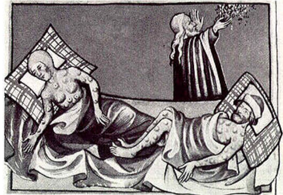
ภาพวาดเดอะแบล็กเดธ ในคัมภีร์ Toggenburg Bible (1411)

กาฬโรค มีสาเหตุมาจากเชื้อแบคทีเรีย เยอซิเนีย แพลสติก ( Yersinia pestis ) ซึ่งแพร่ระบาดอยู่ในสัตว์จำพวกหนู ( Rodent ) ในแถบตอนกลางของเอเชีย แต่ยังไม่เป็นที่ทราบแน่ชัดว่าเป็นที่ใด ที่เริ่มมีการระบาดร้ายแรงในช่วงศตวรรษที่ 14 ทฤษฎีหนึ่งที่น่าเชื่อถือ กล่าวไว้ว่า ในทุ่งกว้างแถบเอเชีย ประมาณช่วงตอนบนของประเทศจีน จากที่นั่นเดินทางมาจากทั้งทางทิศตะวันออก และทางทิศตะวันตกทาง ไปตามเส้นทางสายไหม ( Silk Road ) ซึ่งพวกกองทัพและพ่อค้ามองโกล สามารถใช้เส้นทางการค้านี้ได้ฟรี จากบารมีของราชอาณาจักรมองโกล ( Mongol Empire ) ภายใต้สนธิสัญญาแพก มองโกลลิกา ( Pax Mongolica ) ที่จะรับรองความปลอดภัย ซึ่งมีคำเปรียบเปรยไว้ว่า "แม้หญิงใดเดินเปลือยกายผ่านเส้นทางนี้ก็จะปลอดภัย แม้ชายใดถือทองคำ ใส่กระจาดทูนไว้บนหัวก็จะไม่ถูกปล้น"